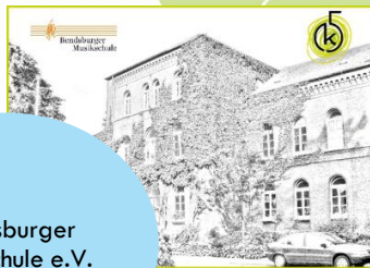
Rendsburger Musikschule e.V.