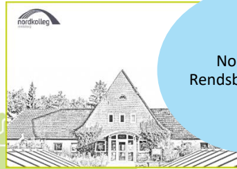
Nordkolleg Rendsburg gGmbH