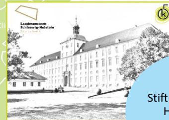
Stiftung Schleswig- Holsteinische Landesmuseen