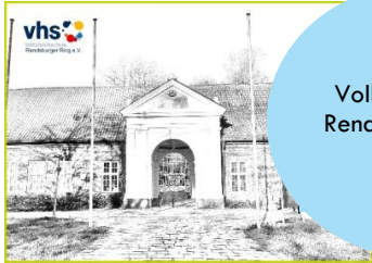
Volkshochschule Rendsburger Ring e.V.