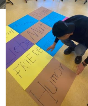
Meine Werte – Deine Werte: AVDaZ- und BG EE- Klassen des BBZ am NOK, Rendsburg