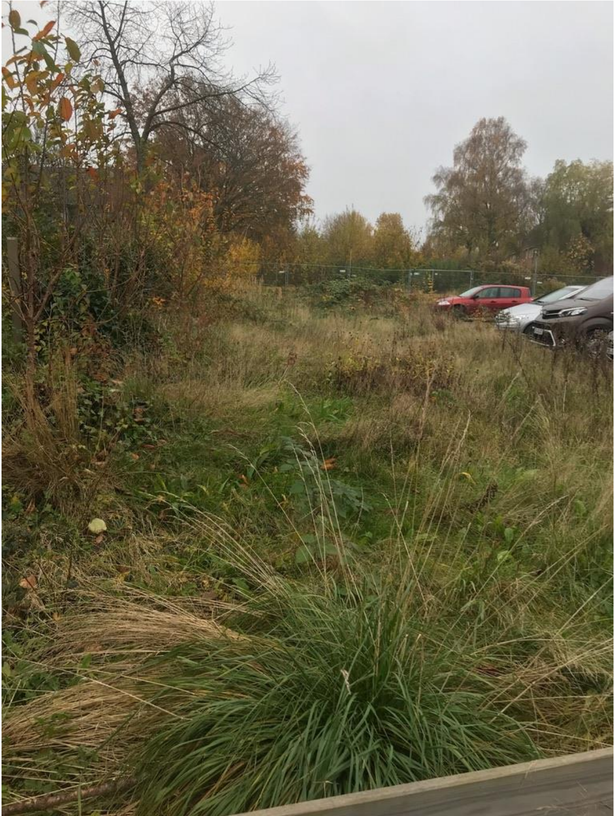
Vorgesehener Standort für Obstbäume an Astrid-Lindgren-Schule