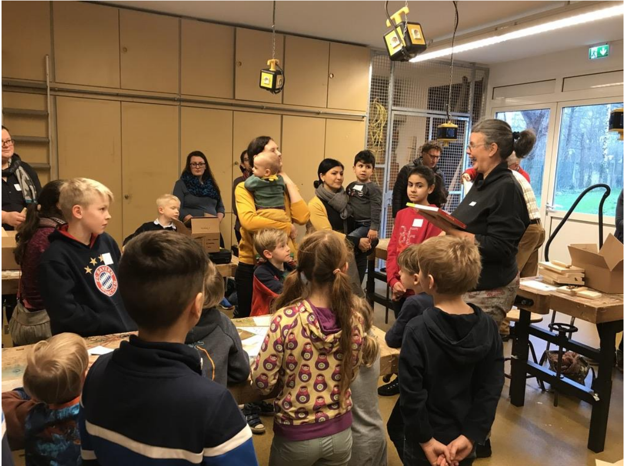
Seminar Blühwiesen anlegen AWR