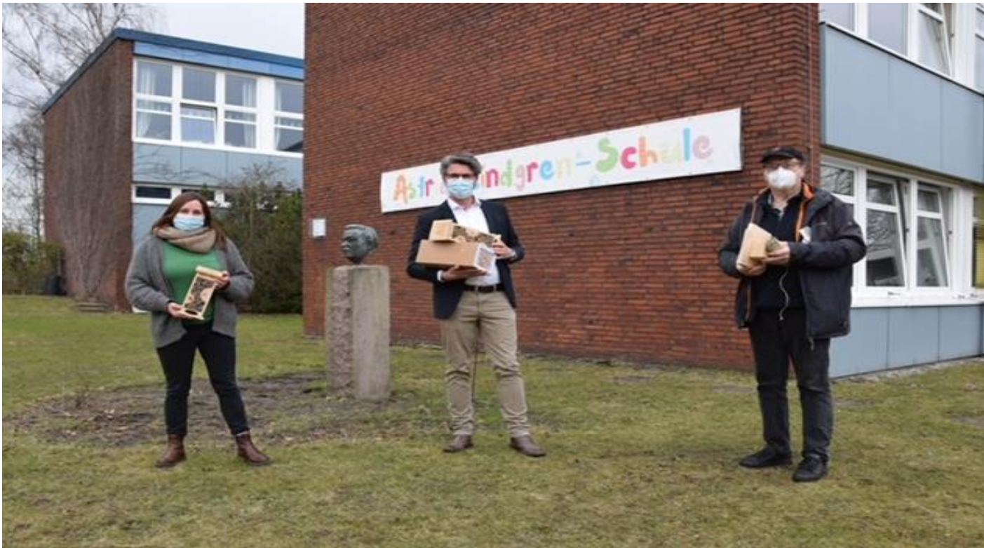
Übergabe Insektenhotels an Schulleitung Astrid-Lindgren-Schule Büdelsdorf