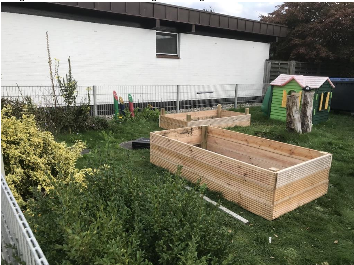
Hochbeete für die Kindertagesstätte Liliput Büdelsdorf