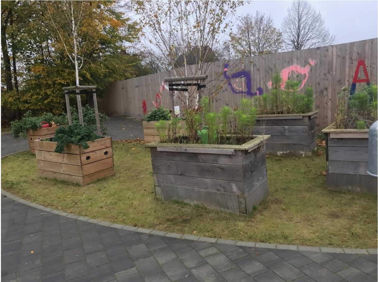
Hochbeete der Astrid-Lindgren-Schule