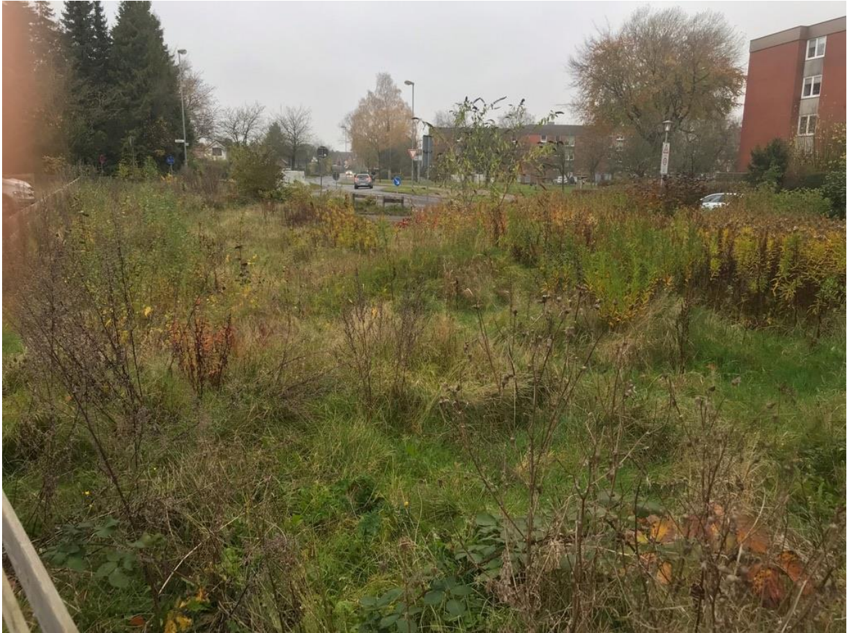
Blühwiese an der Astrid-Lindgren-Schule