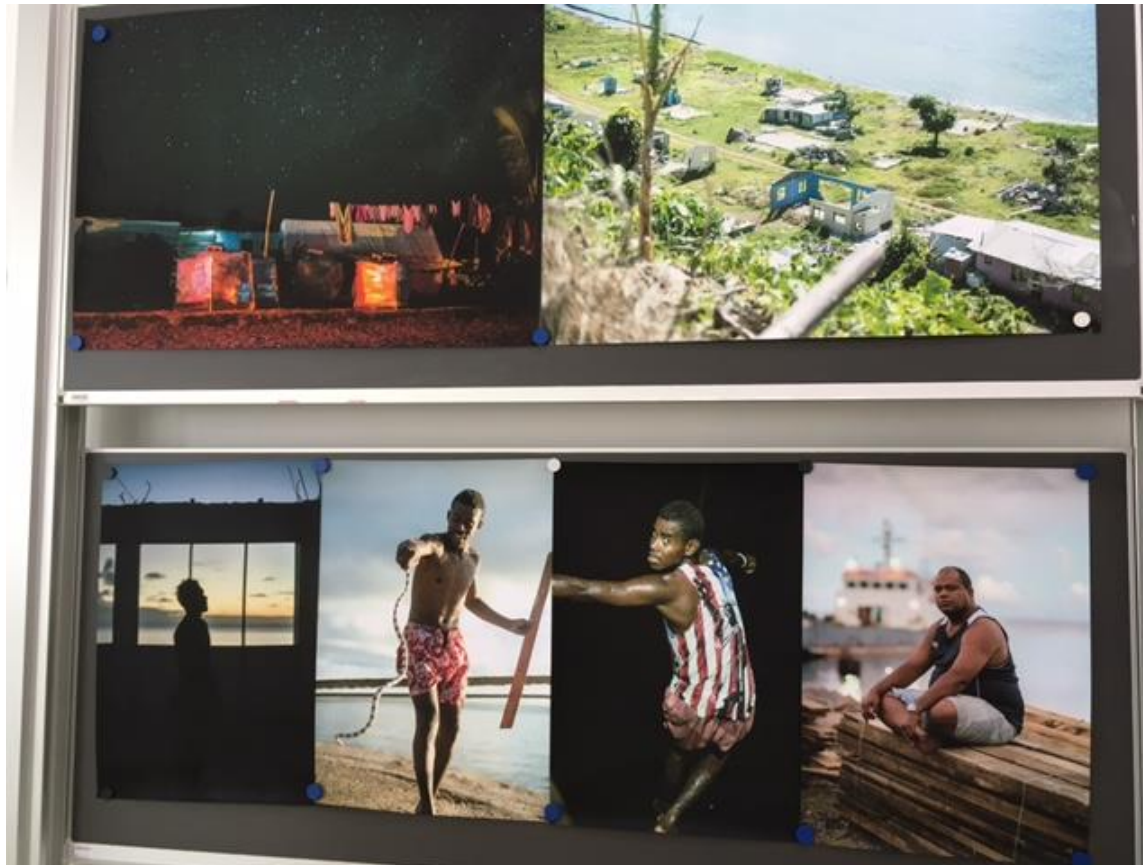
Auftakt: Fotografien von Ramona Gastl zum Umgang des Menschen mit der Belastung ihrer Meere