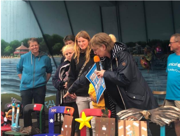
Das kreative Team