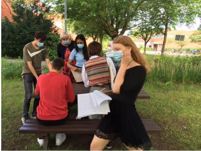
SuS des Gymnasiums Kronwerk beim konzentrierten Arbeiten am Thema „Lyrik & Meer“