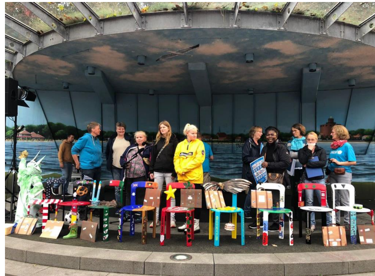
Projektvorstellung auf der Bühne des Kindertages