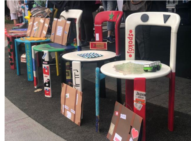
Ein Platz für jeden – überall auf der Welt