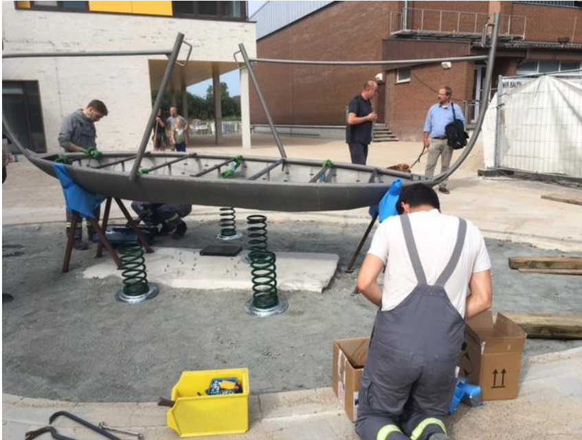
Aufbau des Kunstwerks auf dem Schulhof der Gemeinschaftsschule