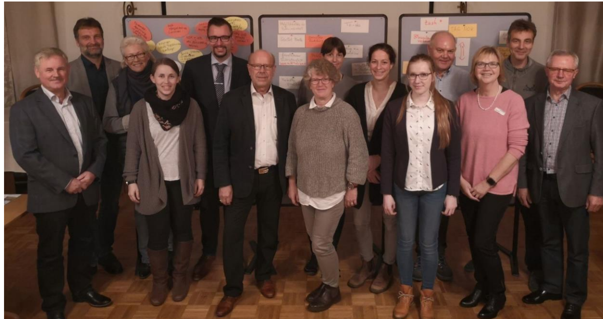
Strategie-Workshop Dezember 2018