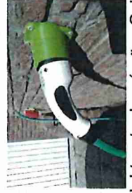
Halter für Elektrostecker (grün: Schülerprojekt)