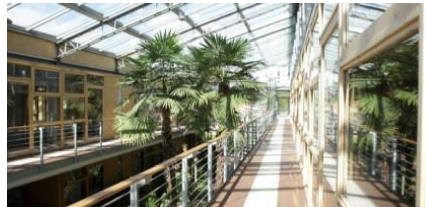
Technik- und Ökologiezentrum Eckernförde