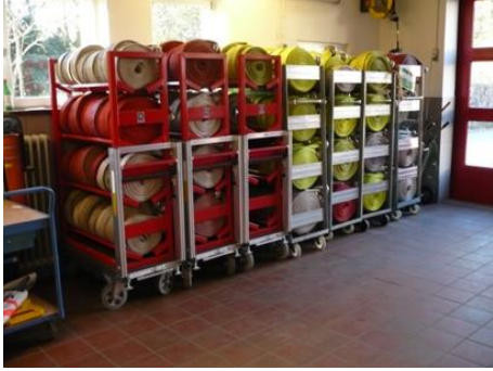
Schläuche in der FTZ

In der anliegenden Tabelle 4 sind die grundsätzlichen Leistungen einer FTZ und die sich daraus ergebenden erforderlichen Dienstleistungen der Kreiswehrführung danach abgebildet, welche Aufgaben die FTZ derzeit wahrnimmt, wie nicht wahrgenommene Aufgaben zu priorisieren sind, welcher Zusatzaufwand damit verbunden ist und an welchen Standorten eine Aufgabenerfüllung möglich ist.