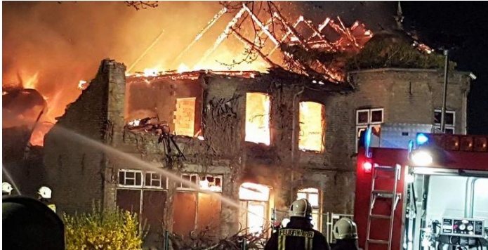
Die Feuerwehr Hohn im Einsatz

Ein Entwurf, wie der Anbau an den Bestand des LZ-G aussehen kann, ist der Anlage zu entnehmen.