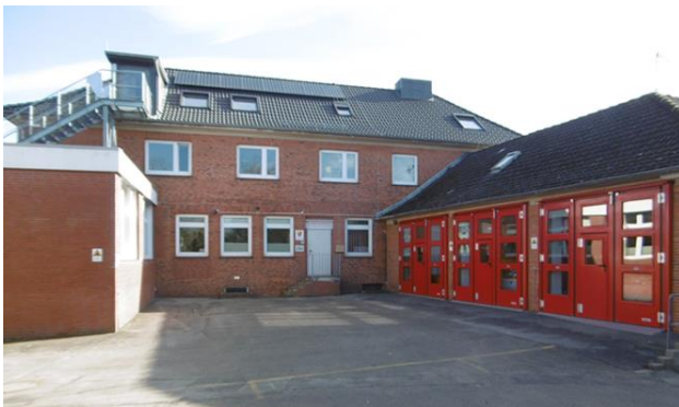
Die Feuerwehrtechnische Zentrale

In der FTZ gibt es Büro-, Besprechungs-, Lager-, Sozial- und Schulungsräume sowie Werkstattflächen und Unterstellflächen für Fahrzeuge. Am meisten Platz nimmt die Werkstattfläche mit 348 Quadratmetern in Anspruch.