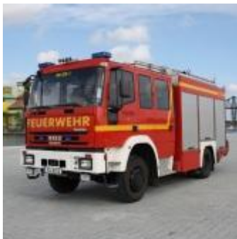
Tanklöschfahrzeug des LZ-G (TLF) Quelle: http://www.lz-g.de/redaxo/

Die neue Fünf-Jahresplanung 2019-2023, die die Planungen bis 2020 berücksichtigt, beinhaltet ein Investitionsvolumen von 1,14 Millionen Euro bei einem durchschnittlichen Investitionsbedarf von jährlich 228.000 Euro. Bei dieser Planung wurden die Ergebnisse des vorliegenden Gutachtens mit entsprechenden Erneuerungen bzw. Ergänzungen berücksichtigt. Dabei wurden auch die vom Gutachter ermittelten Raumkapazitäten sowohl in der FTZ als auch beim LZ-G mit einbezogen. Der Mittelwert der Investitionen der Kreise Schleswig-Holsteins beträgt hier 181.754 Euro 11 .